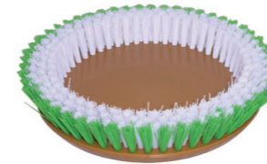
Schrubbürste Art.-Nr. 202.011