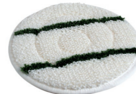
Queen Bonnet-Pad - Art.-Nr. 202.034 Erzielt auf Teppich und Teppichboden beste Reinigungsergebnisse.