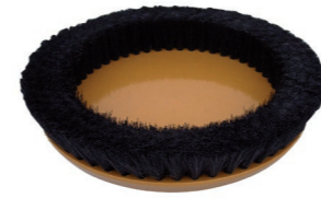
Schamponierbürste Art.-Nr. 202.012