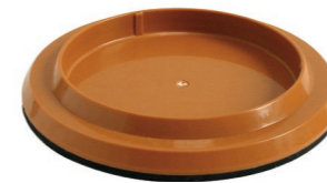
Pad-Treibteller Art.-Nr. 202.010

Extrem laufruhig und kinderleichte Bedienung, auch für ungeübte Anwender und Einsteiger geeignet.