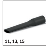
11, 13, 15