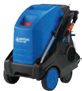
MH 4M X