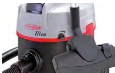
Je eine Parkposition auf beiden Seiten des Kopfes.