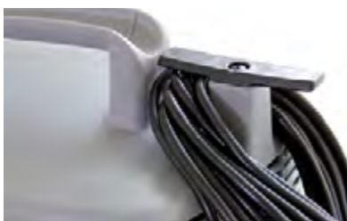
Verschließbarer, geräumiger Kabelhaken.