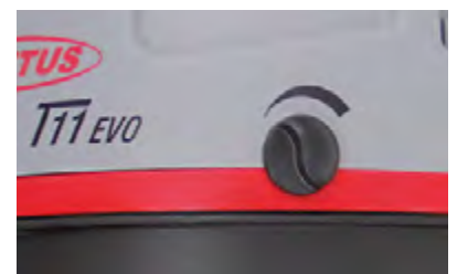
Leistungsregulierung zur optimalen Einstellung auf jeden Bodenbelag.