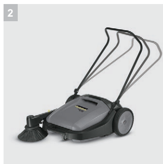
2 Einstellbarer Schubbügel