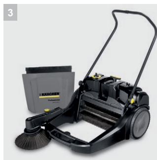
3 Großer Schmutzbehälter