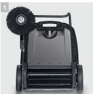
1 Antrieb Hauptkehrwalze